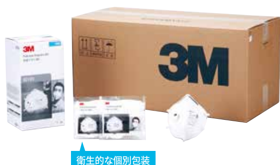
衛生的な個別包装