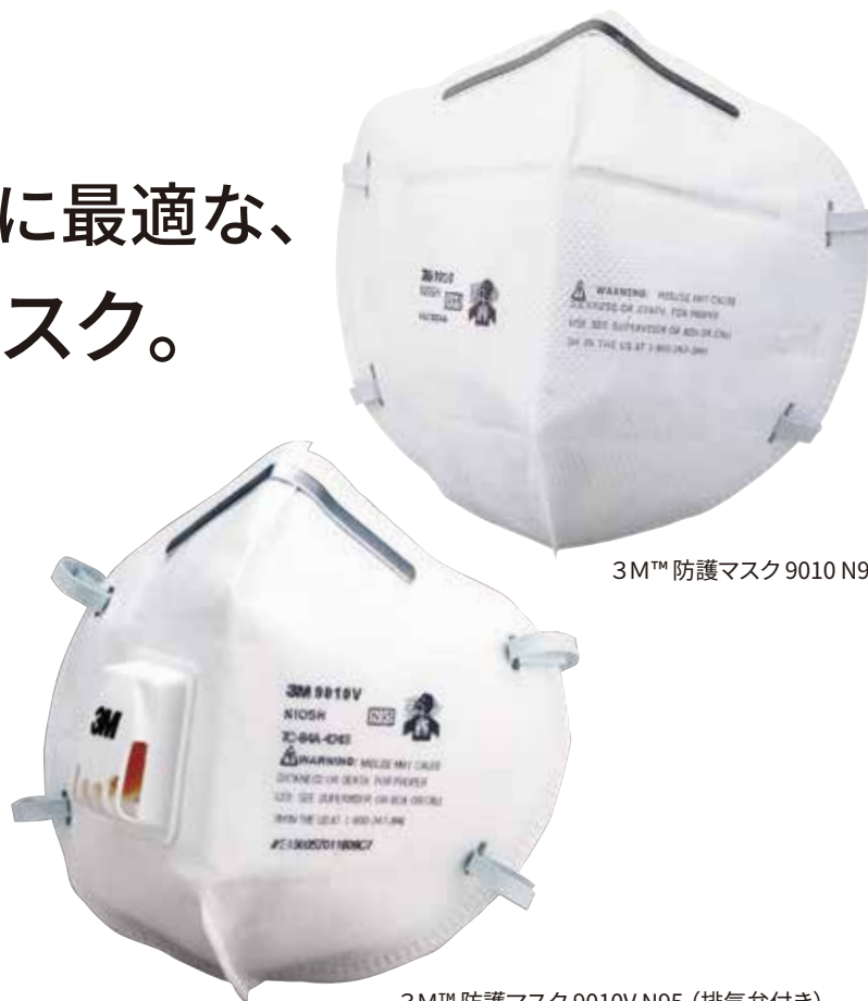
3M™ 防護マスク 9010 N95

新型コロナウイルス対策やPM2.5対策にも 安心してご使用頂ける、 米国NIOSH（国立労働安全衛生研究所） による認定を受けたN95マスク。 保管・携帯に便利な2つ折タイプ。