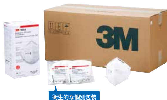
衛生的な個別包装